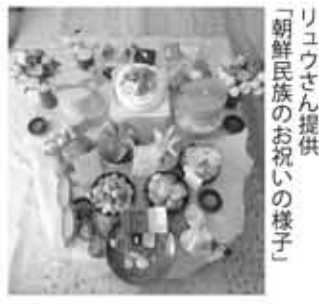
「朝鮮民族のお祝いの様子」

ね。1歳のときは、「トルチャンチ」というパーティーを開きます。その時「トルジャビ」という、赤ちゃんの将来を占う行事があります。赤ちゃんの目の前に、紙幣、小槌、マイク、鉛筆などを並べ、何を先に手にとるか、みんなで見守ります。紙幣は見たとおりお金持ちに、小槌は裁判官に、マイクは歌手や芸能人に、鉛筆は小説家など書き物をする職業に。写真は、中国朝鮮族の友達のお嬢さん1歳誕生日の時に撮った写真です。韓国と同じ風習です。